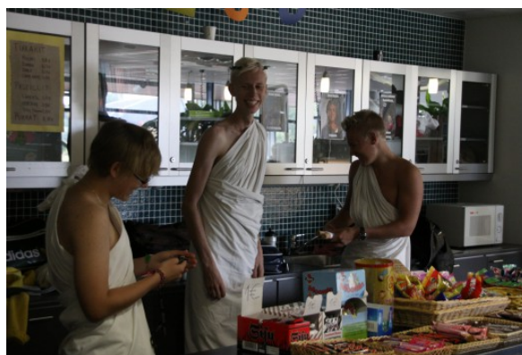
Kuva 14: Puljussa tapahtuu!

teesta Muumitikkareista. Puljun kirjakierto pelasti viimein kirjojen hommaamisen jättäneet opiskelijat aivan viime hetkellä ennen tuntien alkua. Hallituksen kautta uusille abiturienteille tilattiin jokavuotisia abivaatteita sekä ylioppilaslakkeja. Myös melkein jo perinteeksi nousseiden elokuvahetkien järjestäminen ja opiskelijabileippujen jakaminen jatkui.