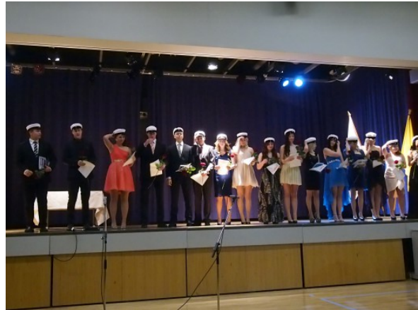
Kuva 16:

Tarkiainen Eetu Joonas Kristian Väänänen Arttu Oskari