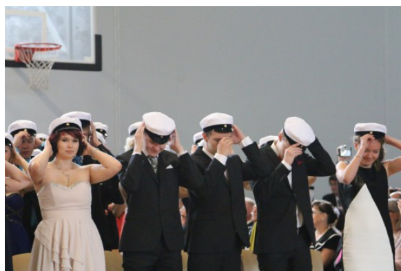
Kuva 17