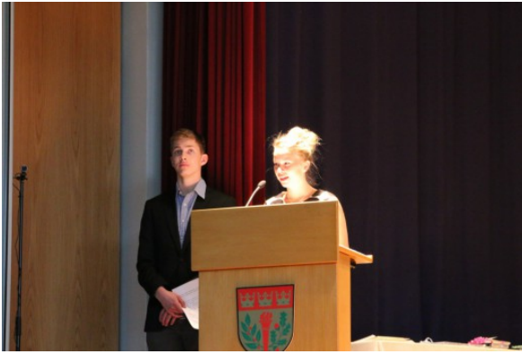
Kuva 15: Oppilaskunnan hallituksen edustajat kevätjuhlassa