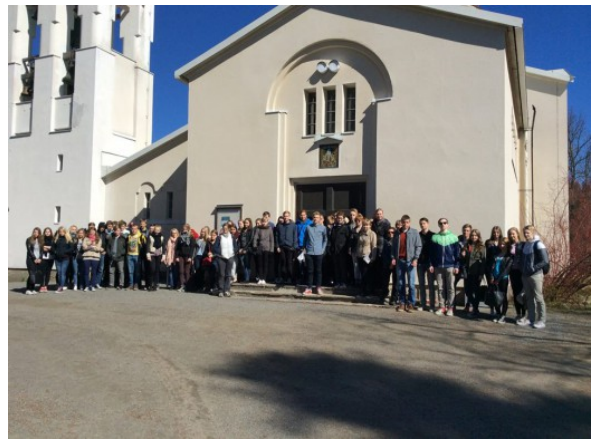
Kuva 10: Vierailulla Valamossa

Perjantaina 16. toukokuuta 2014 osallistuivat Klassikan ranskan opiskelijat kurseilta B2 4 ja B3 6 Ranskan suurlähettilään Éric Lebédelin luennolle Kuopion Lyseon lukion juhlasalissa. Luennon aiheena olivat Suomen ja Ranskan suhteet keskiajalta nykypäivään ja luennon jälkeen oli mahdollisuus esittää kysymyksiä.