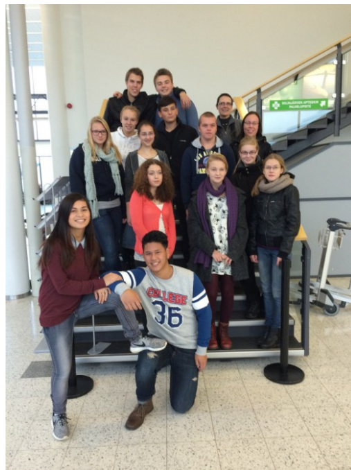
Kuva 11: Klassikan oppilaita ystävyyskoulussamme Wilhelmshavenissa, Saksassa.

Parhailtaan on suunnitteilla uusi vaihto Neues Gymnasium Wilhelmshaven –koulun kanssa, joten vierailuista toivotaan kehittyvän Klassikalle uusi perinne.