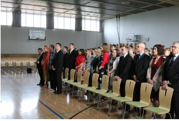
Kuva 18: Kevätjuhla 2014