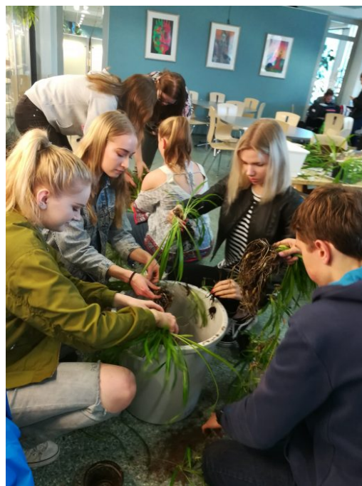
Kuva 1: Kasvikerholaiset upottivat sormensa multa

Uusia kakelaisia kaivataan taas pitämään huolta koulumme viherviihtyvyydestä.