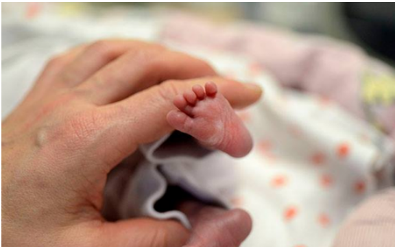
Kuva 14: Klassikan kädenojennus itsenäisen Suomen pienimmille

Suomi100-juhlan pääsylipputuotto ja iso nallekarhu lahjoitettiin KYSin keskosille.