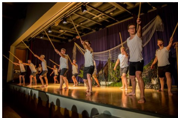
Kuva 11: Urlun pojat vauhdissa