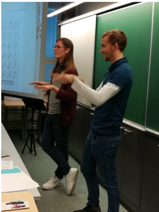
Kuva 6: Tulkkiopiskelijat opettivat klassikkolaisille viittomakieltä