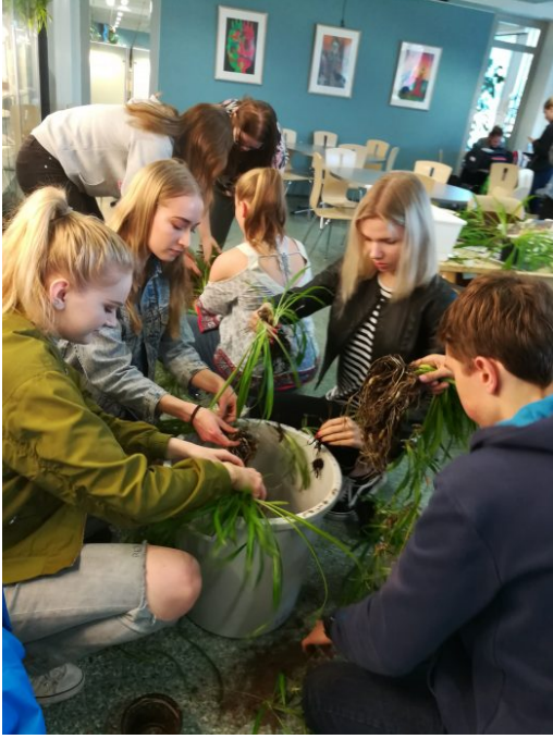
Kuva 16: Kasvikerholaiset upottivat sormensa multa