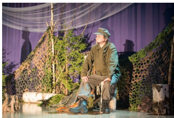
Kuva 12: Klassikan Tuntematon vei yleisön sotivuosiin