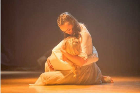
Kuva 13: Sotatunnelmaa tanssien

Suomi100-juhlan pääsylipputuotto ja iso nallekarhu lahjoitettiin KYSin keskosille.