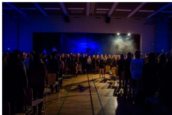
Kuva 10: Klassikan suurkuoro loi juhlatusnelmaa

Päiväjuhlan lisäksi järjestettiin iltajuhla täpötäydelle salille kotiväkeä.