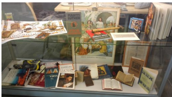
Kuva 9: Näyttelyvuorossa psykologia

Koulun aulassa esiteltiin oppiaineiden historiaa koko juhalavuoden ajan. Oppimateriaaleja eri vuosikymmeniltä etsittiin opettajien omista, eläköityneiden opettajien ja kirjastojen kätköistä.