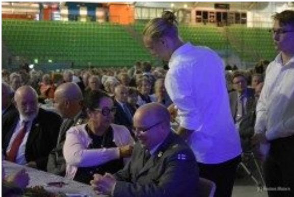
Kuva 4: Opiskelijat avustivat veteraanijuhlassa

Lukuvuoden aluksi klassikkalaiset avustivat Veteraanien rosvopaistitapahtuman järjestelyissä. Juhla alkoi opiskelijoiden lippukulkuella. Opiskelijat toimivat juhlassa myös tarjoilijoina ja avustivat veteraaneja juhlan aikana.